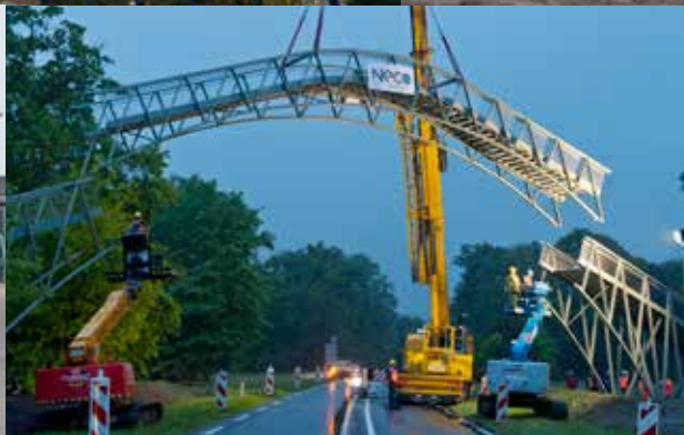
Productie en montage VOETGANGERSBRUG OVER N346, TWICKEL te DELDEN | Impressie werkzaamheden